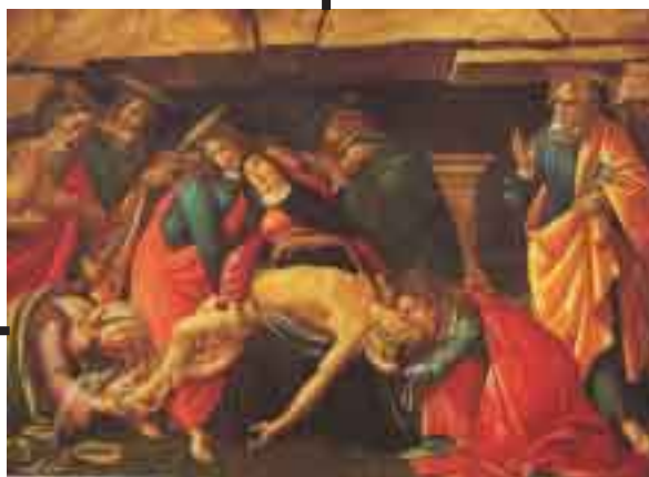
Votre affliction tournera en joie (Jean, XVI)

Vous pouvez recevoir par courrier un dossier complet du S.C.F. (fournir une enveloppe affranchie).