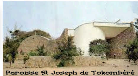
Paroisse St Joseph de Tokombéré

3 PLACE ST-GERMAIN-DES-PRÉS 75006 PARIS WWW.TOKOMBERE-INTERTOK.ORG