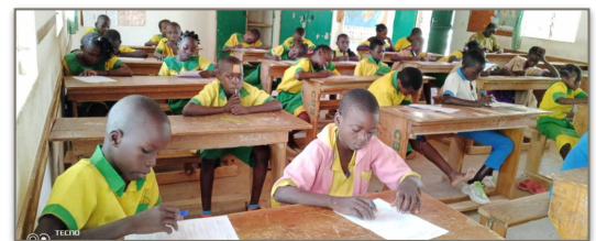
Des élèves composant le concours d'entrée en 6 ème