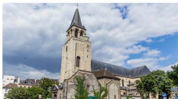
Paroisse St Germain des Prés