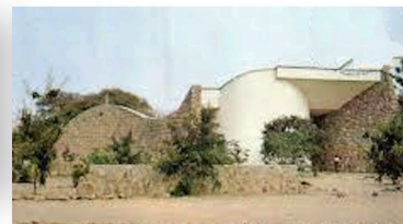
Paroisse St Joseph de Tokombéré

3 PLACE ST-GERMAIN-DES-PRÉS 75006 PARIS WWW.FONDATIONCHRISTIANAURENCHÉ-TOKOMBÈRE.ORG