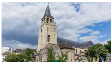
Paroisse St Germain des Prés