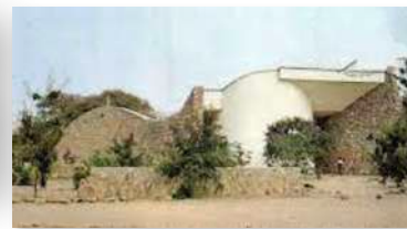
Paroisse St Joseph de Tokombéré

www.eglise-saintgermaindespres.fr (Onglet : SERVIR>TOKOMBÉRÉ)